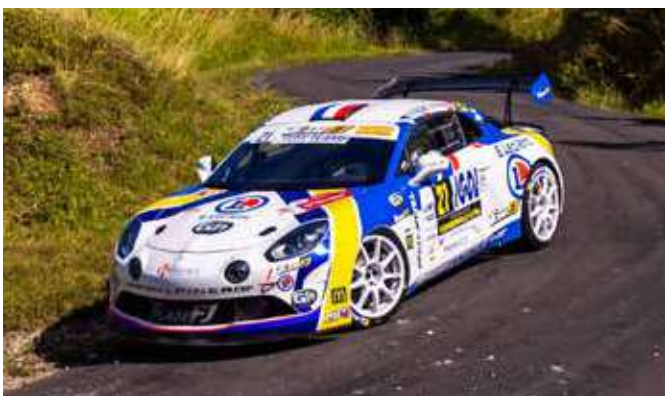
Pierre Roché exploite au mieux son Alpine A 110 GT