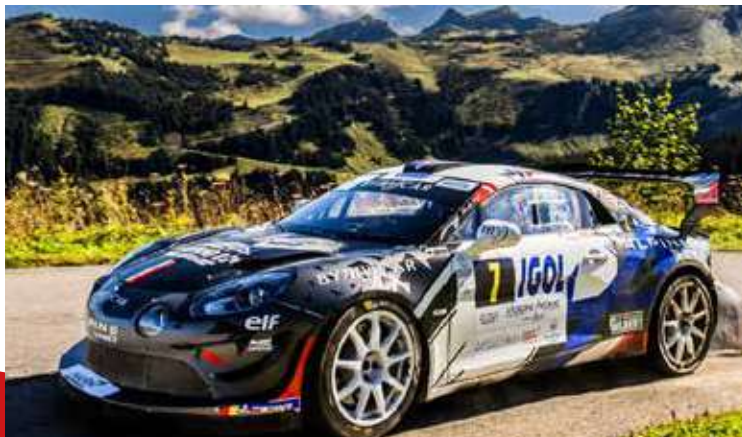
La nouvelle Alpine A 110 RGT + a fait forte impression pour sa sortie officielle au Mont-Blanc, ici aux mains de Quentin Gilbert