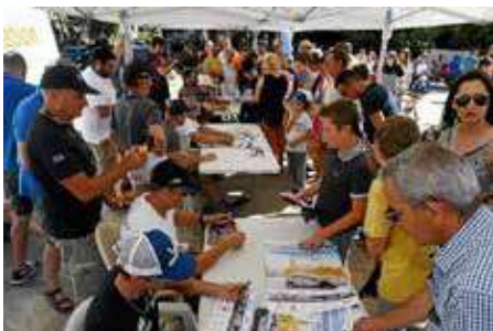
Les fans apprécient les séances de dédicaces.

Le public raffole de côtoyer les pilotes et de leur faire signer des dédicaces. Cette séance vendredi 27 septembre de 16 h à 17 h 30 change de lieu et se déroulera sur le parvis Rochambeau en présence des têtes d'affiche et des meilleurs pilotes régionaux.