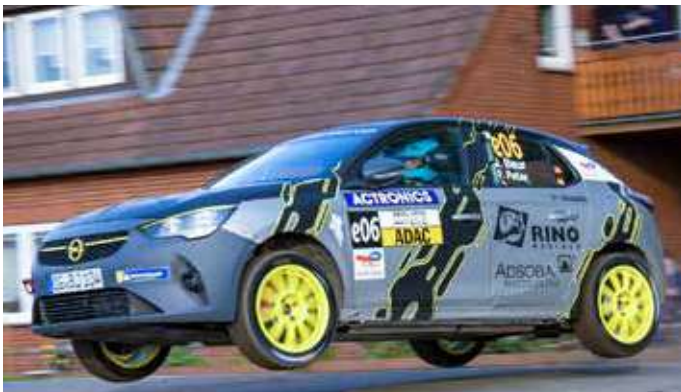
Le public risque d'être bluffé par l'accélération de ces Opel Corsa... électrisantes !