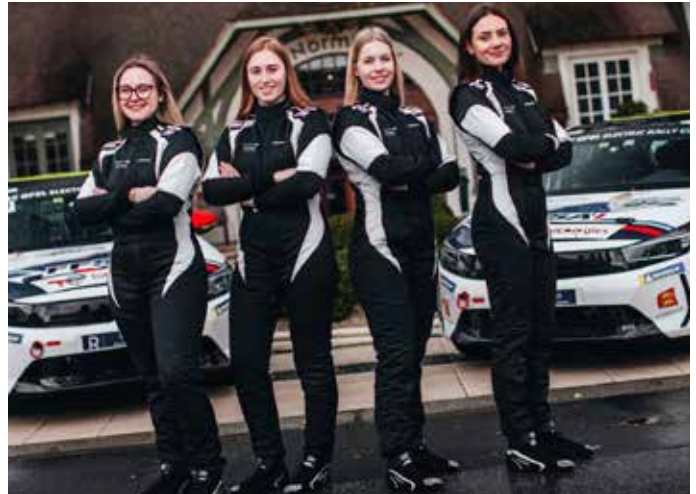
Les deux équipages féminins français engagés dans l'ADAC OPEL e-rally Cup

E n ce moment, on parle beaucoup de voitures électriques avec ses détracteurs mais aussi ses fervents partisans. Mais quid des autos de course ? C'est là que réside l'attraction de l'édition 2024 avec l'engagement d'une dizaine d'Opel Corsa 100 % électriques dans le cadre de l'ADAC OPEL e-rally Cup «powered by GSe». Cette coupe européenne se déroule sur huit rallyes dont trois en France (Vosges-Grand Est, Mont-Blanc et Cœur de France) et se clôturera en octobre par le rallye d'Europe centrale, manche du championnat du monde des rallyes WRC. Le groupe Stellantis dont fait partie Opel mobilise beaucoup d'énergie dans cette expérience sportive qui fait figure de pionnière en course automobile sur route. Le public sera surpris des chronos réalisés par ces autos proches de la série puisqu'elles ne développent que 100 kW/136 ch. À Vendôme, de